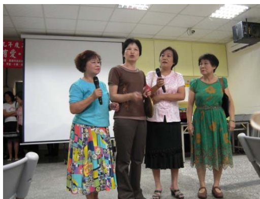
圖 5 民享社區劇場排演