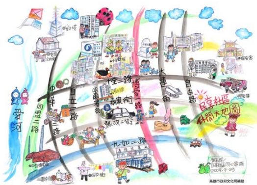
圖 4 民享社區文化地圖

為了讓更多的社區居民了解社區內所存在的老人安養的問題，民享社區利用社區劇場將問題呈現出來。故事內容敘述獨居老人因為子女不在身邊，獨自一人生活的情景，種種令人鼻酸的劇情引起社區居民的共鳴，並得到廣大的迴響，增加了社區居民對於老人安養問題的重視。