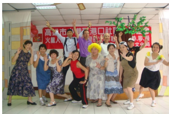
圖 3 港口社區劇場