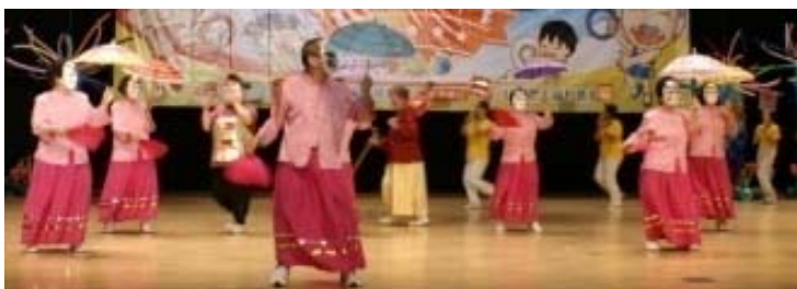
圖 10 安泰社區十二婆姐陣

2013 年加入了社區大廟--關帝廳(南天宮)的傳統藝陣文化，讓『車鼓陣』、『十二婆姐陣』能延續在地的情愫，發揚傳統廟埕故有的歷史傳承。在既有的社區營造基礎上，將傳統地方戲曲，廟埕藝陣文化，現代話劇，融合為一，辦理現代融合板的社區劇場。透過挖掘社區居民共同生活軌跡，編製劇場演出腳本將原有話劇社，及歌仔戲班演出內容，以現代手法融入大廟藝陣文化元素—『車鼓陣』、『十二婆姐陣』，改編為現代舞台劇演出方式，以最健康美妙的方式呈現。