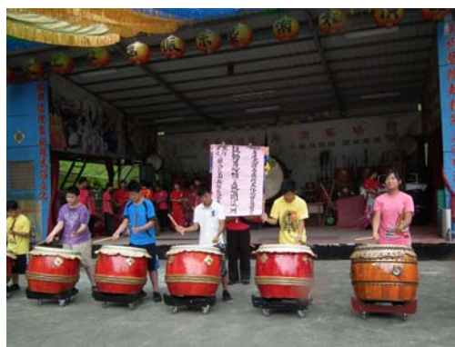
圖 7 社區內學童參與太鼓技藝