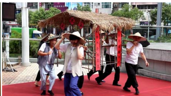
圖 9 居民扛柱仔腳厝躲水患