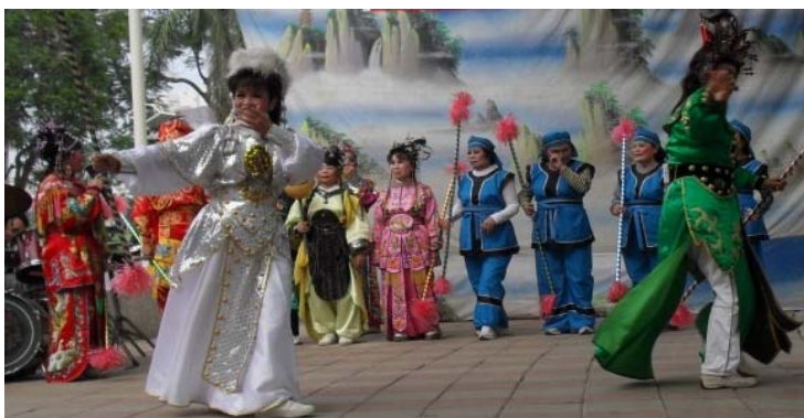
圖 11 安泰社區歌仔戲