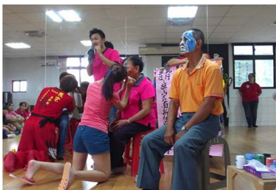
圖 6 社區劇場表演準備