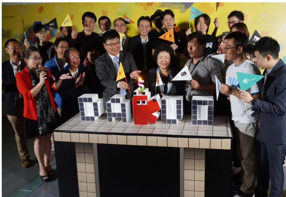
圖 3 市長與國內外新創團隊為 DAKUO 五週年慶生

為確保大型廠商投資高雄能有大型辦公空間可立即進駐，活化捷運「O2B 共構大樓」作為中大型廠商落腳高雄的中繼據點，成功輔導兔將視覺特效股份有限公司及緯創資通股份有限公司進駐高雄。截至 2018 年 2 月底共陸續進駐 47 家廠商，新產品研發超過 190 件，增加就業人口超過 760 人，共計辦理 1,442 場次招商與社群交流等活動，約 5 萬 2,951 人次參加，已成為高雄數位內容產業的發展基地。