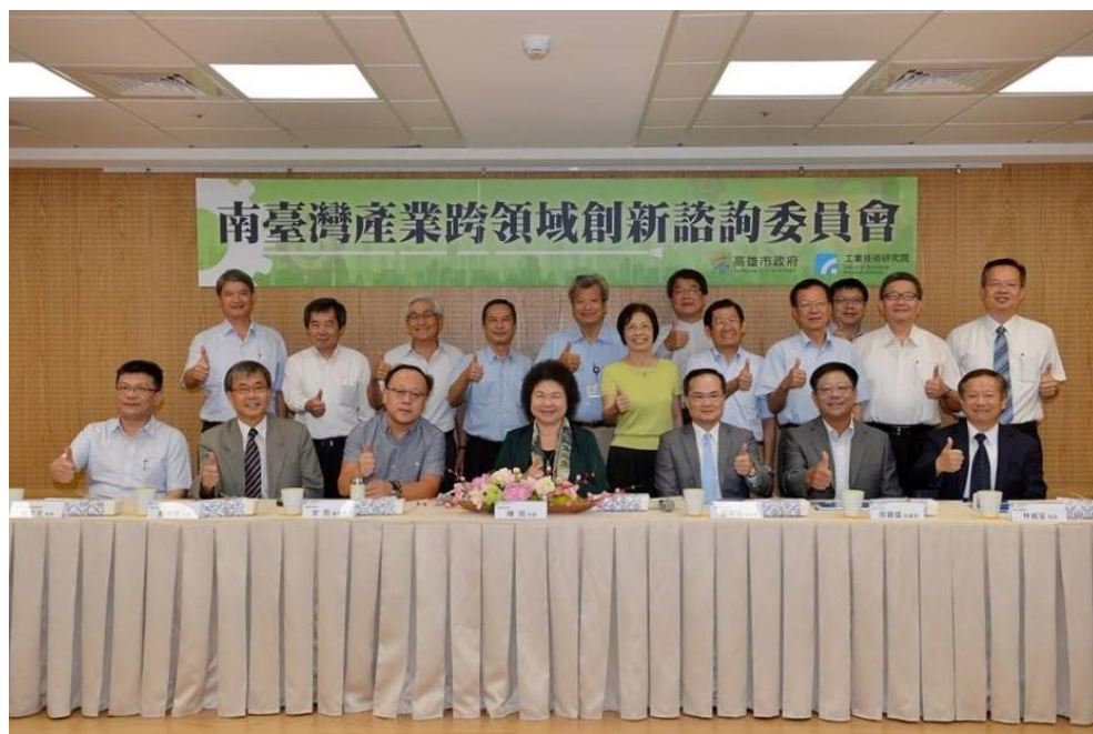
圖 5 召開南臺灣產業跨領域創新諮詢委員會

該中心 2017 年度已召開 2 場諮詢委員會探討產業技術發展方向，並辦理 1 場媒合會及 5 場新創相關課程協助輔導及媒合資金需求，共輔導成立了 4 家新創事業及協助 16 案新創事業籌資事宜，2018 年將擴大輔導創投事業發展，健全高雄市創新創業環境。