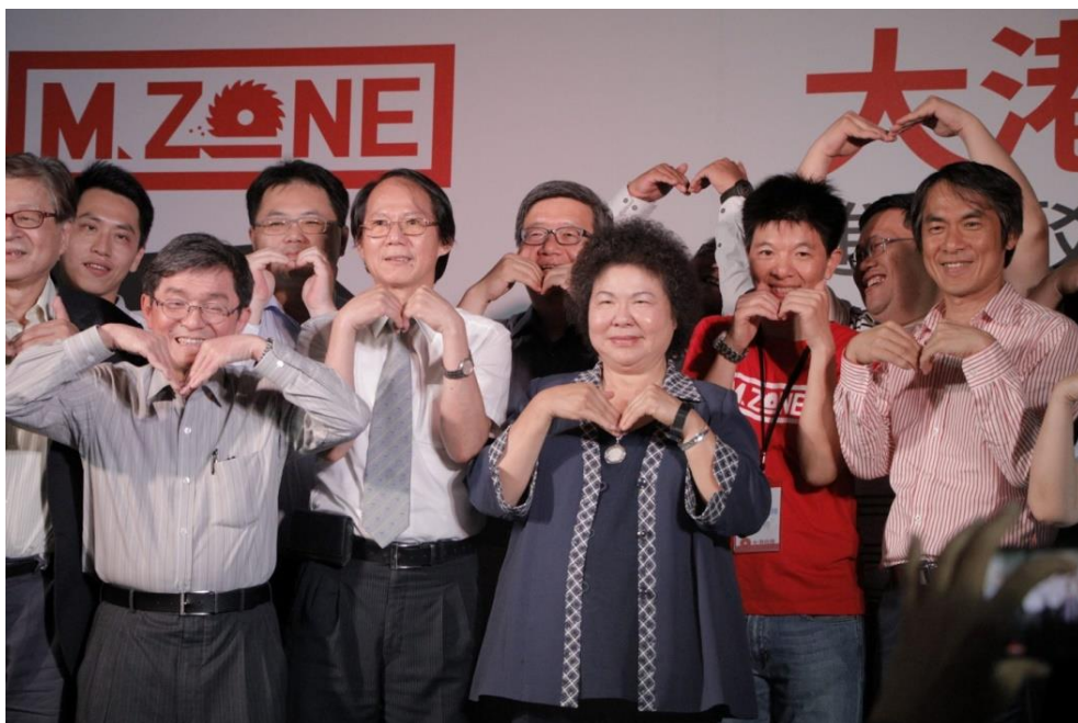
圖 4 M.ZONE 大港自造特區開幕

一個由高雄出發、立足臺灣的自造者空間，透過展覽分享、課程規劃、社群聚會、活動辦理等方式與自造者社團進行串聯，將「自造者精神」帶給大眾。2016 年 6 月 9 日成立「M.ZONE」，將倉庫打造成為「Maker Hub」，並以自造者概念為利基，推動傳統製造業鼓勵內部員工進行創意與自造者運動，帶動企業內部進行自我創新之可能，為傳統產業驅動創新價值，再造傳統產業榮景，並達成促進民間投資、增加出口及提升就業水準等經濟發展目標。2017 年底至 2018 年初曾以網路平台「嘖嘖」為策展活動進行群眾募資，分別順利達標 272%及 280%，成功募集上百位支持者共同實踐為動手而生的策展理念，已辦理 8 場次大型展覽，講座及課程活動 400 場以上，至少 15 萬人次以上參與，會員人數已突破百人。