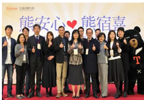
圖 5 城市好旅宿連續二年獲直轄市特優