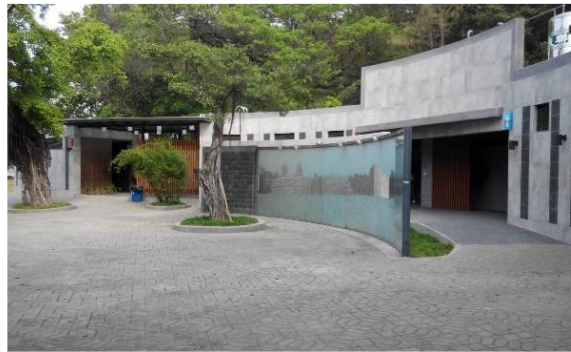
圖 16 國際知名觀光區域-蓮池潭風景區：整體重新改造老舊設施、公廁及融入周遭景觀特色，更新為共融式遊具公園