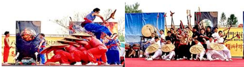
圖 8 2018 全國創意宋江陣頭大賽