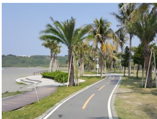
圖 11 旗津海岸公園及自行車道 串聯