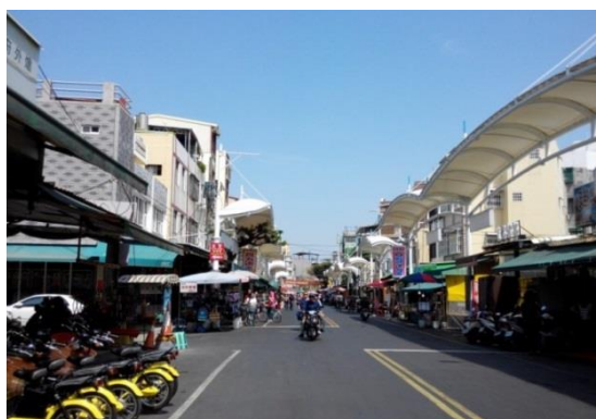
圖 10 改造旗后商圈，活絡商圈人潮及經濟