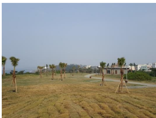
圖 12 新建旗津海韻露營區提供 遊客體驗野炊樂趣