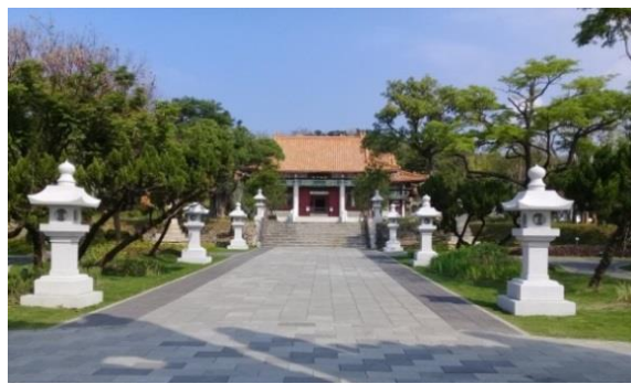
圖 18 忠烈祠前身為日本神社之歷史記憶，吸引許多日籍遊客拜訪，改造後景觀優美自然