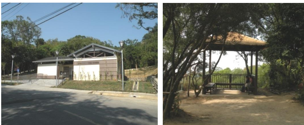
圖 15 本市重要登山休閒景點-觀音山風景區，改善老舊服務設施， 以營造友善登山環境