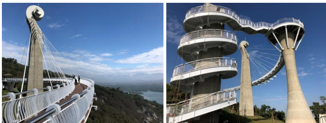
圖 20 崗山之眼：斜張結構的特殊設計，以音樂為主題打造的天空廊道

利用小崗山當地地形特色規劃興建「崗山之眼」，採用了斜張結構的特殊設計，最大亮點就是以音樂為主題打造的天空廊道。遊客俯瞰阿公店水庫的湖光美景及岡山、永安市區風光，甚至可遠及北大武山、台灣海峽，站立其上視野可說是相當遼闊。