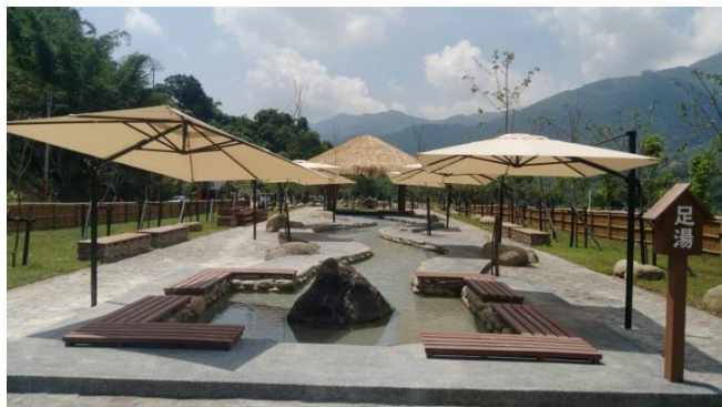
圖 21 寶來花賞溫泉公園示意圖

寶來係高雄著名的溫泉鄉，惟 98 年莫拉克颱風造成溫泉源頭受損，溫泉產業大受影響，故 100 年縣市合併後，市府先進行寶來大街改造，提升寶來遊憩品質，並於 103 年開始進行溫泉探勘工作，於 106 年初成功開鑿出具開發規模的溫泉井，緊接著開闢了寶來花賞溫泉公園，將溫泉水引進公園內供遊客體驗；遊客在寶來花賞溫泉公園內，除了可享受群山環繞的美景外，亦可享受賞花兼泡湯的優雅風情。