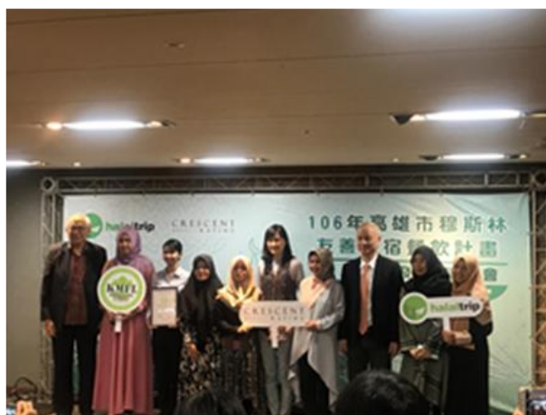
圖 3 穆斯林友善餐旅認證共通過 15 家