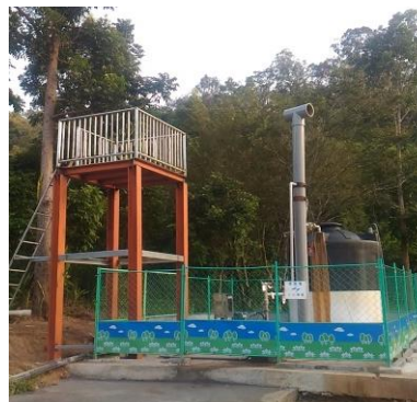
圖 22 溫泉鑽井成果示意圖