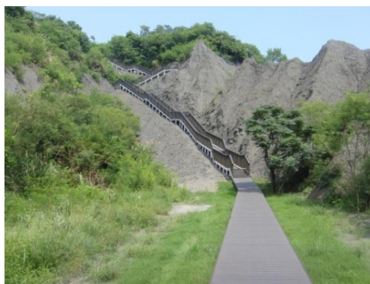
圖 9 月世界風景區創造國內最優質的特殊地質體驗園區