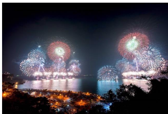
圖 7 2017 高雄燈會大港花火秀