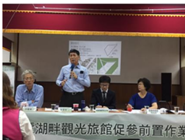
圖 4 蓮潭湖畔觀光旅館促參案公聽會