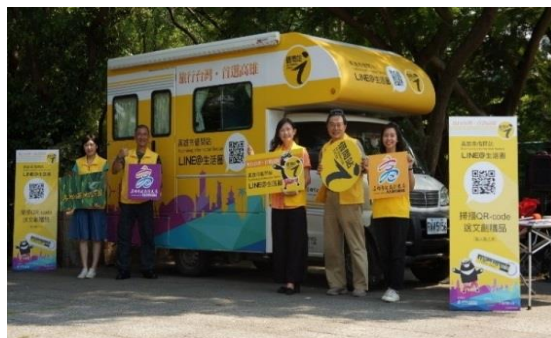
圖 2 借問站 Line@生活圈及 行動旅服車亮相