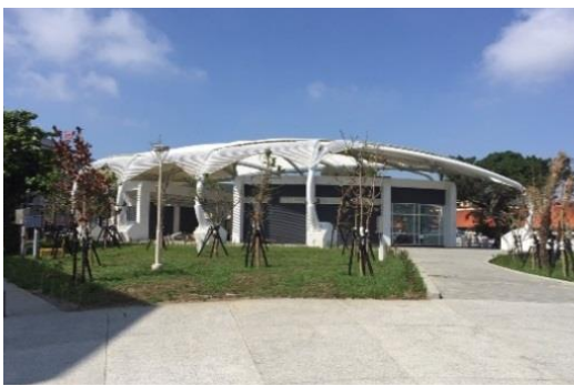
圖 17 西子灣遊客中心，提供旅遊資訊服務，可眺望旗后山、燈塔及港都雄偉景觀的最佳地點