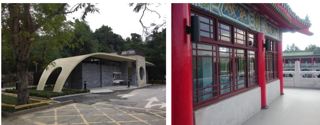
圖 14 澄清湖入口處公廁重建、淡水館改建遊客中心暨文史館使用， 提升園區遊憩品質