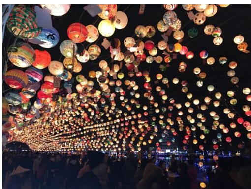
圖 6 高雄燈會彩繪燈籠隧道

高雄燈會自 2001 年起開始舉辦，至今已邁入第 18 年，藉由高雄燈會藝術節將高雄市在地文化、歷史背景、地理景觀並搭配生肖進行佈置，以煙火施放、科技光影展演、燈飾展示及節目展演，表現高雄意象及國際特色，同時結合商圈力量，營造多元化藝術歡樂、趣味、熱鬧的節慶氛圍，吸引眾多國內外遊客參觀，帶動本市觀光產業發展。每年的高雄燈會藝術節計平均約吸引 300 萬人次遊客參觀，創造每年約 17.71 億元觀光產值。