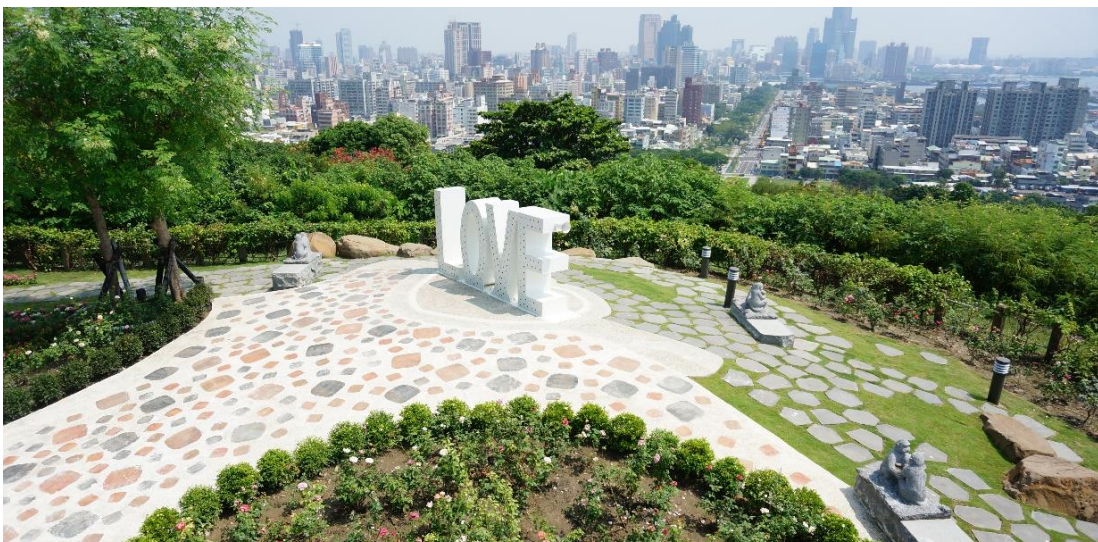
圖 19 以愛情主題的壽山情人觀景台，創新的 LOVE 藝術雕塑，成為熱門打卡必遊景點