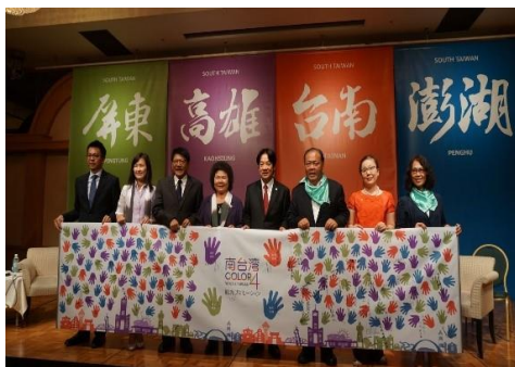
圖 1 南臺灣跨縣市推廣會

於高鐵左營站、高雄火車站、小港機場等 3 處交通節點設立旅遊服務中心，並於 105、106 年連續 2 年榮獲交通部觀光局評鑑首獎及特優獎；又與統一超商合作設立全市 48 個「借問站」，可隨處獲取各種語版旅遊摺頁及旅遊諮詢服務。另外，經營「高雄旅遊網」、臉書、微博及 IG 等社群網站，除提供遊客食、宿、遊、購、行等「一站式」旅遊資訊查詢服務外，亦即時發送在地觀光特色訊息及照片。而首創「高屏澎好玩卡」推出迄今已發行超過 8 萬張、開發超過 20 套旅遊產品、整合超過 1,200 張優惠商家，為智慧旅遊發展平臺。