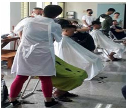
圖 6 義剪活動

高雄漁業以遠洋、近海、沿岸及養殖為主，年產量約 51 萬公噸，年產值約 313 億元。其中遠洋漁業年產量約 46 萬公噸（年產值約 259 億元），占全國遠洋漁業總產量 78%。非我國籍船員是遠洋漁業人力資源的重要來源及夥伴，所以我們長期結合長老教會等民間團體關懷及推動海員漁民權益宣導，不時辦理義診、義剪及聯歡晚會等，並積極增設、提供免費的運動休閒設施，上船訪視其船居生活，更促使中央訂定「境外僱用非我國籍船員許可及管理辦法」，強化仲介管理，提高非我國籍船員的福利待遇及權益保障。