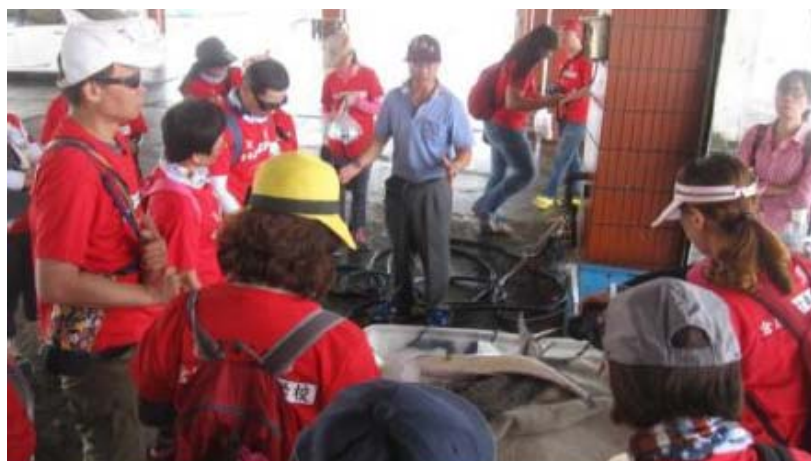
圖 10 彌陀區漁會體驗遊程

像在彌陀就結合在地民俗風情，於重點街區營造更具虱目魚意象，還協助彌陀業者進行產品創新研究、品牌包裝設計及店家氛圍營造改善等。為使民眾更貼近彌陀，體驗在地漁業文化及漁村生活，我們也結合彌陀區漁會共同規劃親子同樂教育體驗遊程，內容包含走訪彌陀漁港，參觀漁船及港邊風情等。