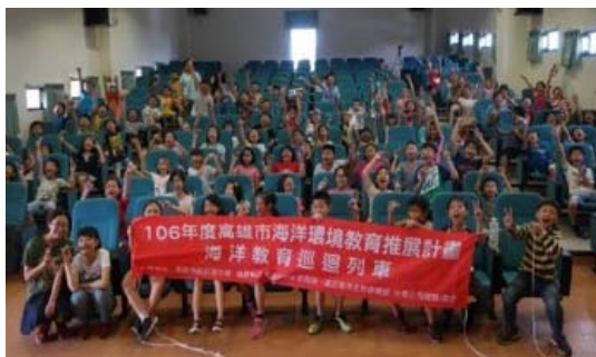
圖 2 海洋環境教育—校園巡迴列車活動