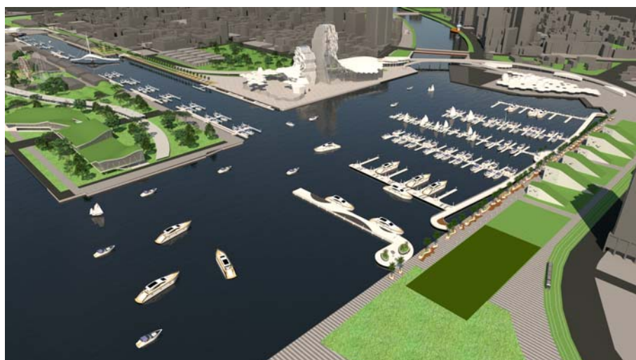
圖 4 愛河灣遊艇碼頭示意圖