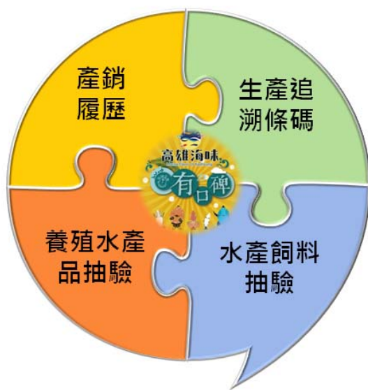
圖 8 高雄水產品衛生安全優質化

我們特別將本市生產的鮪魚、魷魚、秋刀魚、石斑魚及虱目魚，命名「高雄 5 寶」，形塑「高雄海味」品牌形象。透過強化產銷履歷與生產追溯系統輔導，揭露生產者資訊，區隔進口與國產水產品，促進在地生產、在地消費，強化養殖產銷一條龍生產鏈，並經由參加國內外各大食品展及結合行銷網絡與品牌包裝，創造更高經濟產值，甚至在全家便利商店網路及超市型通路，就可以買到優質高雄海味商品。