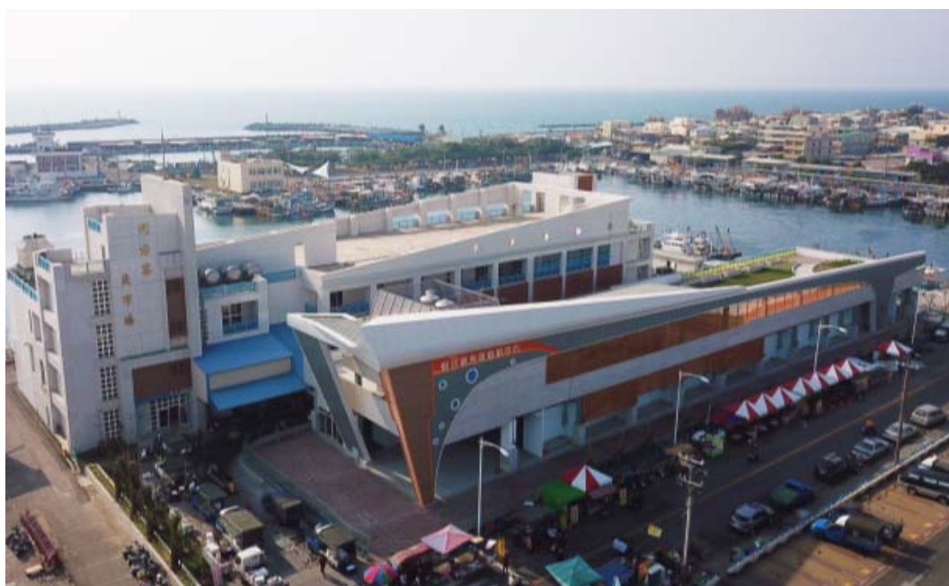
圖 11 蚵子寮漁港