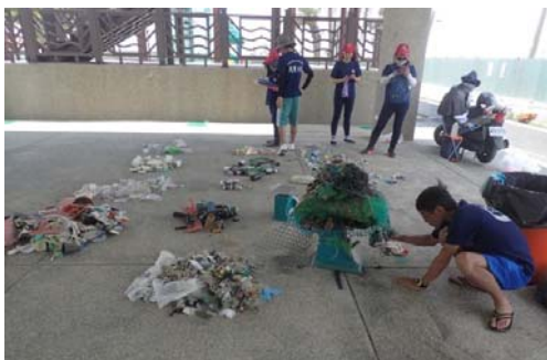
圖 1 淨海活動

為了積極推廣海洋環境教育及漁業文化，讓國中小學生瞭解海洋環境生態與資源保護的重要性，每年辦理「海洋環境教育-校園巡迴列車」活動，利用生動活潑的互動式教學，引導學生認識海洋生物、魚市場及臺灣漁業，提升青少年尊重生命與保護海洋環境的價值觀，巡迴地點除高雄市區及沿海，亦走訪甲仙、六龜、內門等偏鄉，讓不易接觸海洋的莘莘學子體驗海洋的豐富多樣與包羅萬象。