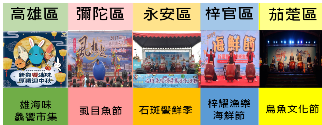
圖 9 高雄海洋文化節慶活動