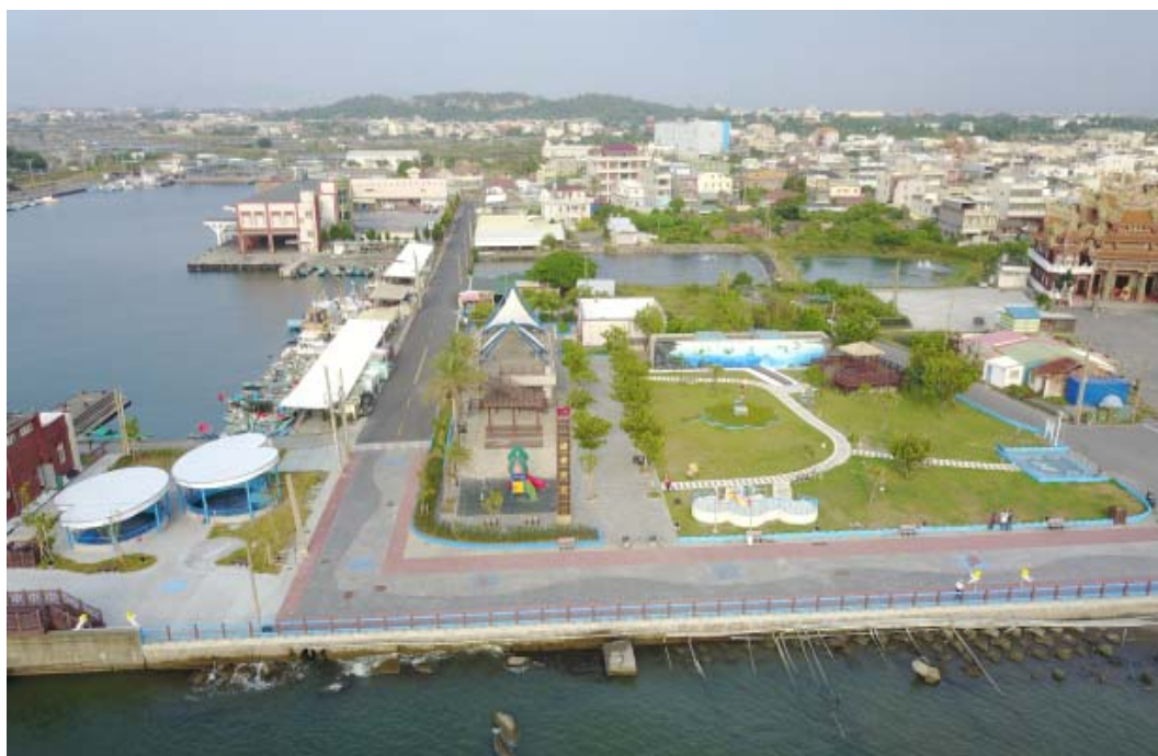
圖 12 彌陀漁港