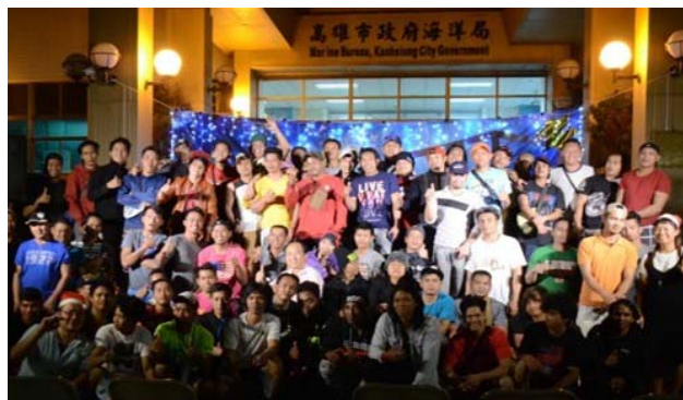
圖 7 漁工聯歡晚會