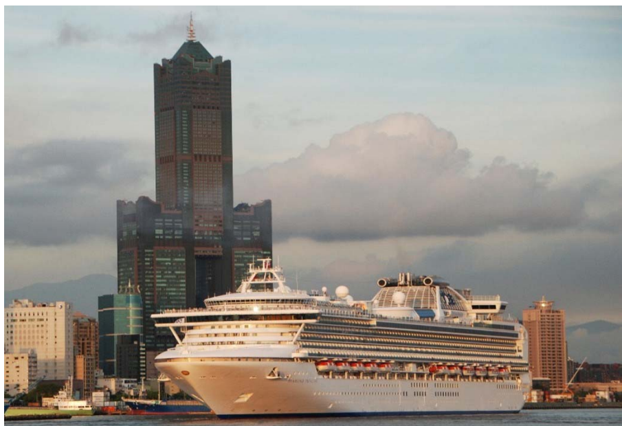
圖 3 郵輪靠港

務公司合資成立高雄港區土地開發公司，打造亞洲新灣區及棧貳庫，將帶動高雄影視產業、會展、文創、水岸觀光與遊艇產業，擴展高雄國際能見度，吸引更多旅客到來。相信隨著高雄港埠旅運中心及亞洲新灣區各項建設逐步落成啟用，高雄郵輪產業亦將邁入新紀元。