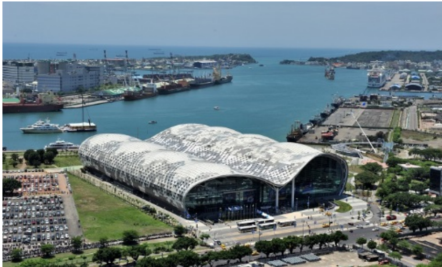
圖 4 高雄市亞洲新灣區