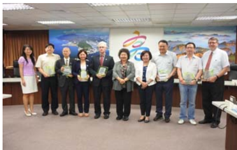
圖 22 106 年國際關係小組委員