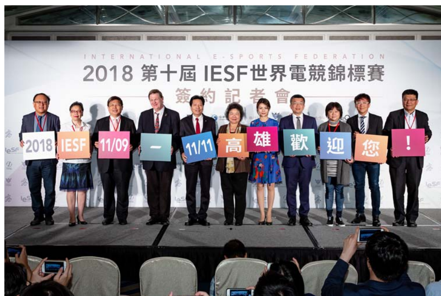
圖 15 2018 IESF 世界電競錦標賽在高雄，「亞洲電競中心向前邁步」

2018 年 11 月，全球最大規模的電競賽事—2018 IESF 世界電競錦標賽，將號召來自 50 個國家的國家代表隊、超過千位選手，與廣大熱情粉絲齊聚高雄，並透過電視、網路直播的串連，讓全球的電競迷如親臨現場般享受眾多高手在 LOL 英雄聯盟、爐石戰記等知名遊戲一較高下的精采競賽。藉由 IESF 世界電競錦標賽的舉辦，除了展現高雄、台灣對發展電競產業的支持，以及在數位網路建設上的成果，更由此翻轉世人對電競運動的刻板印象，為高雄帶來更多推動電競產業、發展產業鏈與產學合作的資源，培育優秀電競人才、優質數位產業環境，同時打造電競產業和數位經濟的堅強軟硬體實力，讓高雄成為「亞洲電競的中心」。