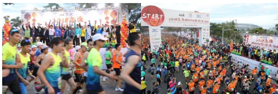
圖 14 2018 國際馬拉松開跑