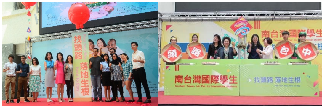
圖 20 南台灣地區國際學生就業