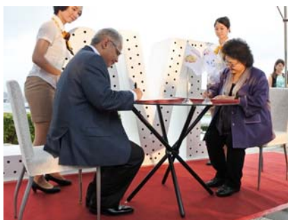
圖 8 本市與巴拉馬市締結姊妹市

高雄藉由與國際城市締結姊妹、友好城市，或簽署特定議題之合作備忘錄，持續擴充國際盟友，現今已擁有 33 個國際姊妹友好城市，而在國家艱困外交環境下，高雄自 2016 年至今，達成與 12 個海外城市締盟之紀錄，顯示高雄成功以人文歷史及產業特色打造城市的「國際辨識度」，帶動城市外交豐富的實質合作成果、提升高雄的「國際能見度」，更確立「國際高雄」的優秀聲譽。本市在亞太、美國、歐洲、南美共 15 個城市都已進行 MOU 簽署城市，今後將持續朝向全球性的區域布局。