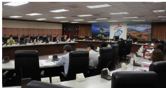
圖 23 召開國際關係小組委員會議