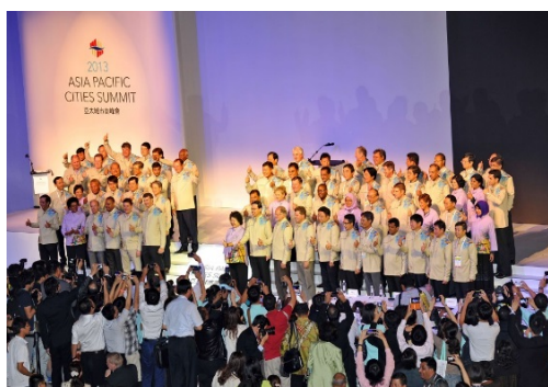
圖 16 2013APCS 首長共同宣言

2013亞太城市高峰會在9月9日至11日3天議程內，舉辦專題演講、青年論壇、展覽及媒合會等。更規劃城市及企業代表參訪，體驗高雄產業轉型的心血結晶。在本次會議中共102個國內外城市、約1,500人參與，並創造豐碩成果，媒合企業簽署合作備忘錄27份，達成本市與日本熊本縣市締結三方合作備忘錄，以及促進釜山、天津、廈門與福州等6個城市對高雄航班增加等。更重要的，2013亞太城市高峰會是高雄繼2009世界運動會後最具規模的國際盛會，其成功經驗更是高雄開拓會展產業的重要關鍵能量。