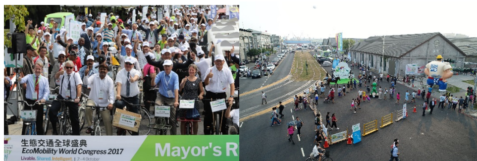
圖 7 2017 生態交通盛典國內外共襄盛舉

2017 生態交通全球盛典於 10 月 1 日至 31 日舉行，大會主題為「宜居・共享・智慧」，規劃生態交通示範區，讓與會者體驗社區如何達到減碳、輕量的目標。而本次大會共吸引 43 國、53 個城市、1200 名參與；展覽及 150 場文史活動則有 35 萬人次、生態交通示範區 7,000 人參觀。尤其盛典期間，生態交通示範區每日平均減少燃油車輛二氧化碳排放量約 7.5 公噸、示範區周邊捷運站運量較平日成長 50.1%、公車運量成長 13.9%，成效可觀。