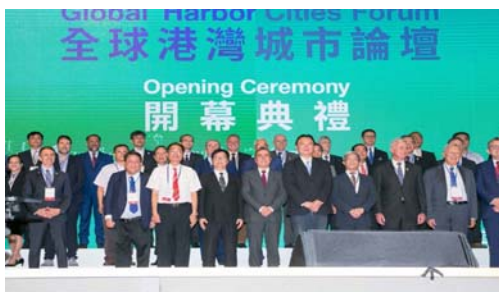
圖 5 2018 港灣城市論壇開幕典禮