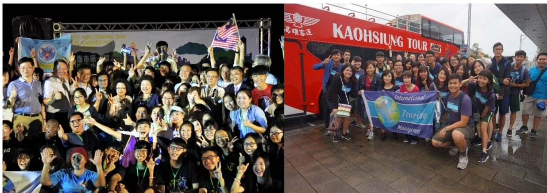
圖 19 高雄市政府舉辦國際學生聯合大迎新

107 年 5 月 25 日本府再次舉辦「2018 大高雄國際學生就業暨給薪實習洽談會」，共有近 20 間高屏地區國際企業提供各類職缺，領域更是橫跨化工、電子、機械器材、製造、扣件、金屬材料、美容及食品加工等類別，活動現場吸引來自馬來西亞 35 國，將近 200 位學生參與，本次活動最大特色為開放給薪實習職缺，媒合在校之國際學生有機會在企業實習就職，先認識高雄在地企業，增進職場經驗，為未來在台灣就業建立良好的基礎。