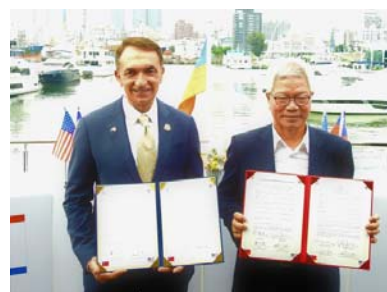
圖 6 本市與美國羅德岱堡簽署遊艇 產業合作意向書