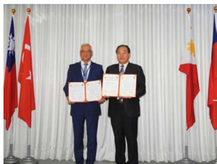
圖 12 鳳山區與土耳其恰娜卡雷市 締盟