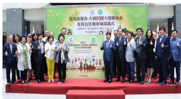
圖 9 本市與韓國大田市締結友好城市