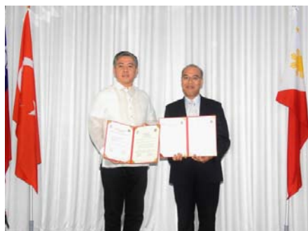
圖 11 鹽埕區與菲律賓第波羅市締盟