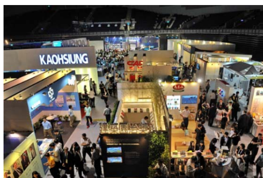
圖 17 2013APCS 會展盛況