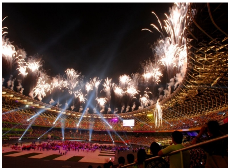
圖 13 2009 世界運動會於高雄國家體育館開幕

活動自開辦以來，參與者及效益皆與年俱增，如 2018 高雄國際馬拉松共 33 國、700 餘位跑者參與，較前一年成長 1 倍（2017 年 308 位跑者），創造的運動觀光效益達新台幣 9,200 萬元。