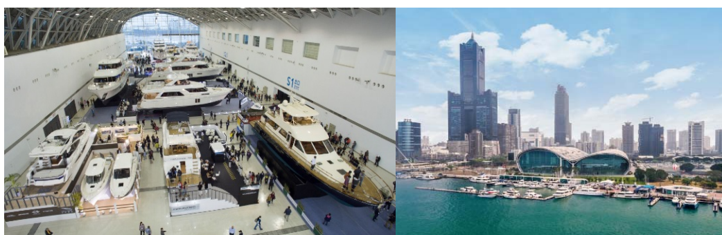
圖 18 台灣國際遊艇展於高雄展覽館室內及水上區的各式遊艇

館室內展廳及水上展區，展出 60 餘艘各式船艇。歷年室內展出最大遊艇達 120 呎、最多參展商 170 家及超過 1000 個攤位，並首創遊艇試乘活動等，每年皆創下 7 萬人次參觀、吸引近 2,000 位國外買主之佳績，累計遊艇成交數近 100 艘、成交金額佔 25 億元。