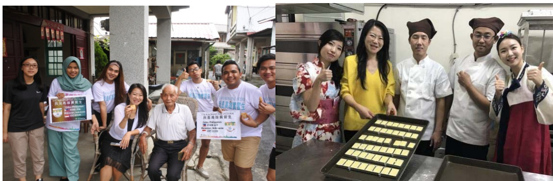
圖 21 我是高雄實習生-深度體驗高雄在地生活

2018 年為促進高雄與新南向國家交流，再次辦理第二屆「我是高雄實習生」，邀請來自高雄姊妹市及友好城市的菲律賓宿霧及印尼望加錫 5 位青年學生，展開為期二週的活動。國際青年學生於 8 月 5 日起，參與高雄科技大學為期 10 天的國際假日學校研習課程，並於 8 月 14 日起進行「我是高雄實習生」的 3 日特訓，透過這次為期三天的實習活動，讓本市與新南向國家姊妹市的情誼向青年世代扎根，更深化姊妹市實質交流。