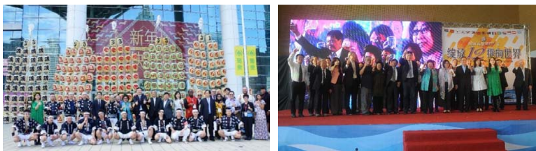
圖 2、圖 3 2018 國際午宴，貴賓齊聚高雄